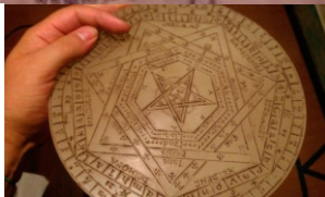
TÁBUA DA LINGUAGEM ENOQUIANA OU CODEX SAERUS SATANIST

"Quando entrarem na terra que o Senhor, o seu Deus, dá a vocês, não procurem imitar as coisas repugnantes que as nações de lá praticam. Não permitam que se ache alguém no meio de vocês que queime em sacrifício o seu filho ou a sua filha; que pratique adivinhação, ou se dedique à magia, ou faça presságios, ou pratique feitiçaria ou faça encantamentos; que seja médium, consulte os espíritos ou consulte os mortos. O Senhor tem repugnância por quem pratica essas coisas, e é por causa dessas abominações que o Senhor, o seu Deus, vai expulsar aquelas nações da presença de vocês. Permaneçam inculpáveis perante o Senhor, o seu Deus. Deuteronômio 18:9-13