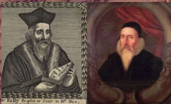
Eduard Kelly e John Dee

Os ocultistas do séculos 16 John Dee e Eduard Kelly registraram em seus diários particulares. Eles alegavam que mágicos e ocultistas se comunicassem com seres angelicais. Em seus livros eles afirmavam que receberam informações de anjos que forneciam a base de linguagem como um alfabeto próprio e ainda receberam revelações sobre o futuro.