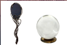
EPELHO OBSIDIANA NEGRA

Respeito a visão de quem acha que o livro de Enoque é inspirado, mas não posso deixar de dizer que extrair dele aprendizado para a Igreja de Cristo é sujar, macular, prostituir a doutrina de Cristo. Irmãos temos 66 livros suficiente para extrair a teologia dogmática para a vida cristã, por favor não fierte com esse tipo de material.