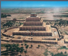
Zigurates feitas para fugir de enchentes como o dilúvio e fazer o nome do homem grande