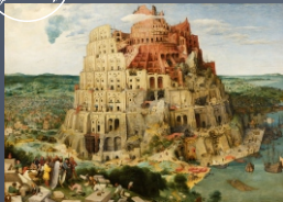
Babel erigida por Ninrode com intuito de fazer o nome do homem grande uma forma de rebeldia contra Deus