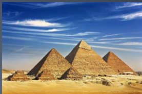
As Pirâmides eram monumentos feitos para a glória do Faraó