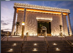
Megas Igrejas, homens perderam o foco em formar homens e amaram mais os púlpitos e seus templos