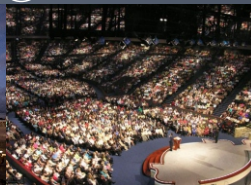
Em vez de formar todos os membros, a igreja moderna foca em centralizar em um líder, fazendo dos membros pessoas mais fracas. Não se preocupam com transição geracional