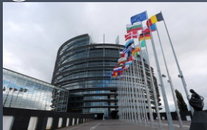
Parlamento Europeu é uma réplica da Babel antiga como forma de unir novamente povos e línguas diferentes