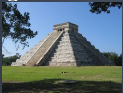
As Pirâmides Maia e Astecas por exemplo eram monumentos dedicadas aos deuses