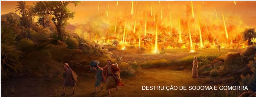
DESTRUIÇÃO DE SODOMA E GOMORRA

Deus disse quem é por mim, mate seu irmão e seu vizinho. Como os ministros do bem estar de hoje explicam essa passagem? Matar ao próximo? O que houve com o Deus de Amor? Na teologia de muitos homens da graça não cabe esse trecho. Outros vão dizer que era por causa da lei. Mas ora Deus seria injusto com os homens da antiga aliança e somente com a gente da nova aliança receberíamos o amor pleno de Deus? Então esse Deus não seria Justiça. Estude a ontologia de Deus, todo o seu ser e você vai entender que Deus não muda, não mudou e nunca mudará. Ele é o mesmo ontem, hoje e sempre será.