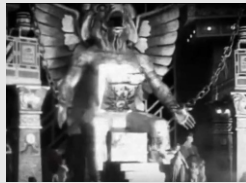
ESTÁTUA DE MOLOQUE