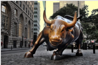
ESTÁTUA DO TOURO NA BOLSA DE VALORES

O segundo pecado foi da idolatria. Adoraram outro Deus, os Israelitas viraram as costas para o Senhor e apostataram, se divorciaram de Deus. Essa atitude dizia que eles esqueceram como Deus os livrou de Faraó, os milagres que Deus fez, as pragas no Egito, o mar se abrindo, Deus os alimentando cuidando e casando com eles no pé do Monte Sinai.